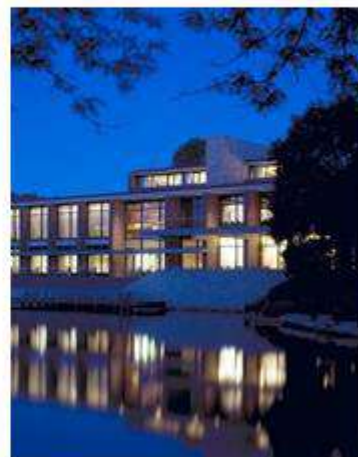
O'Malley, Ouellette, Floude, & Roy 2009