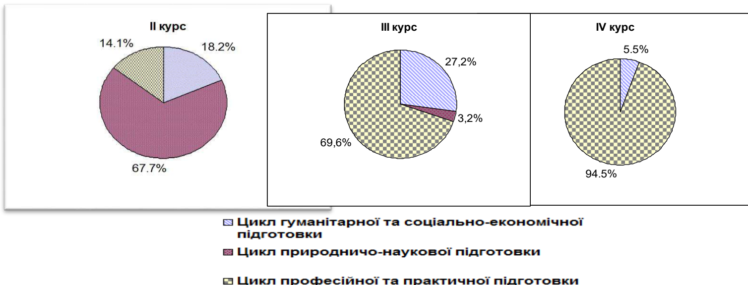
Рис. 1. Діаграма розподілу освітніх компонент (ОК) в рамках освітньо-професійної програми початкового рівня (короткий цикл) вищої освіти підготовки молодшого спеціаліста зі спеціальності 224 Технології медичної діагностики та лікування

Освітньо-професійна підготовка молодших спеціалістів початкового (короткий цикл) рівня вищої освіти зі спеціальності 224 Технології медичної діагностики та лікування, передбачає диференційоване розподілення компонентів трьох циклів: гуманітарної та соціально-економічної підготовки, природничо-наукової підготовки, професійної та практичної підготовки ОП по курсах навчання в залежності від кількості кредитів ECTS (рис. 1).